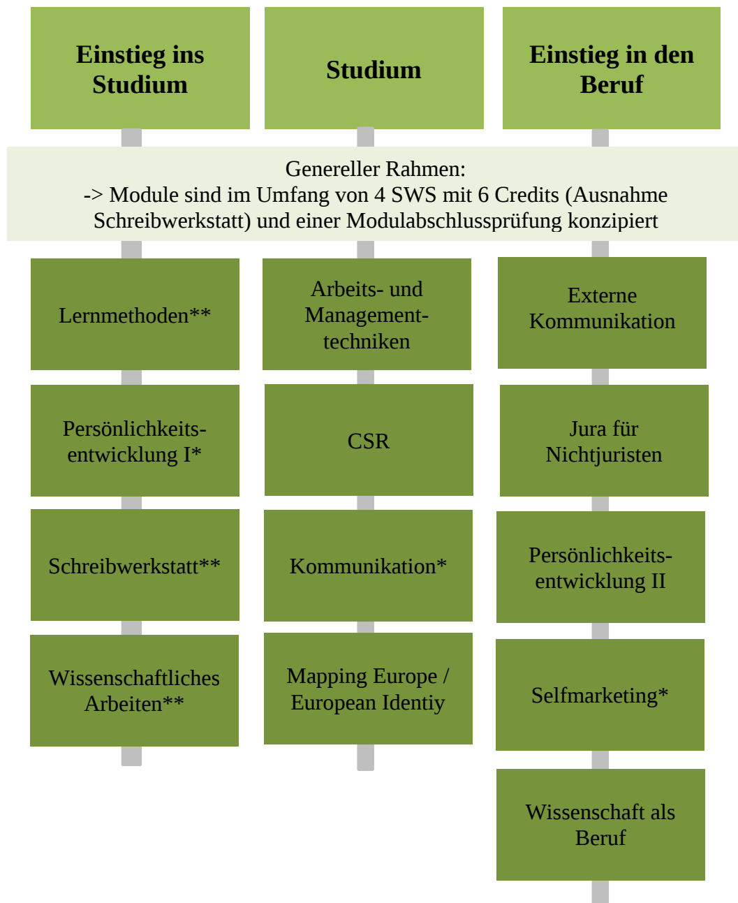
Abb. 2: Überblick Qualifikationsfelder Einstieg ins Studium, Studium und Einstieg in den Beruf der HRW

* Module aufgeteilt in mehrere Veranstaltungen